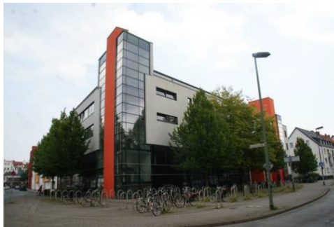
Kolpinggebäude (Geb. 01): Kolpingstraße 7 Das große Gebäude hinter den vielen Fahrradständern.